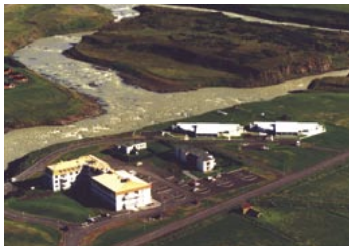
Heilbrigðisstofnunin á Blönduósi og tengdar byggingar í dag

Árið 1905 fara embættislausir læknar að setja sig niður og starfa,