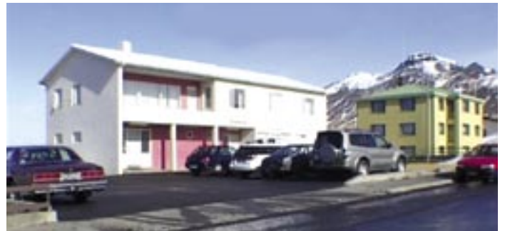
Heilsugæslustöðin á Skagaströnd

Lækni-bústaður var ekki til á Skagaströnd um þær mundir, en var í byggingu er Lárus lét af störfum. Byggingu hans lauk 1967 og fluttist þá aðstaða heilbrigðisþjónustunnar á Skagaströnd þangað. Hafa lækarnir frá Blönduósi haft þar móttöku þrisvar í viku en utan þess hefur oftast setið ljósmóðir eða hjúkrunafræðingur á Skagaströnd og séð um heilbrigðisþjónustu þar ásamt læknum.