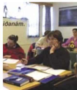
Starfsfólk stofnunarinnar í fjarkennslu