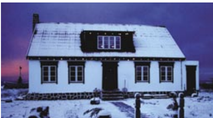
Snorrahús í des. 2003, áður Hemmertshús.