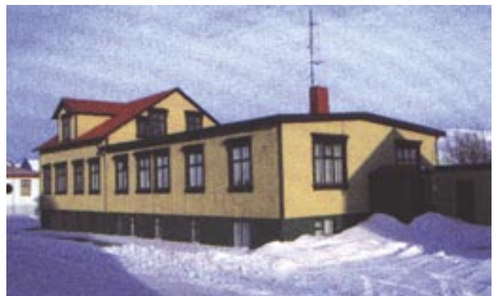
Gamli spítalinn og læknisbústaðurinn á Blönduósi