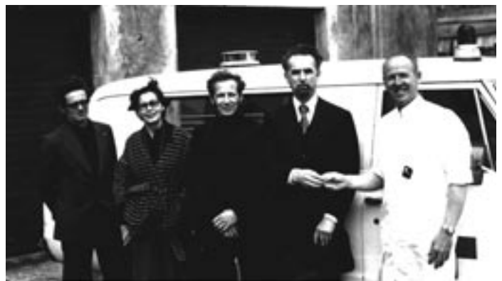
Rauði kross Austur Húnavatnssýslu afhendir Héraðshælinu sjúkrabíl