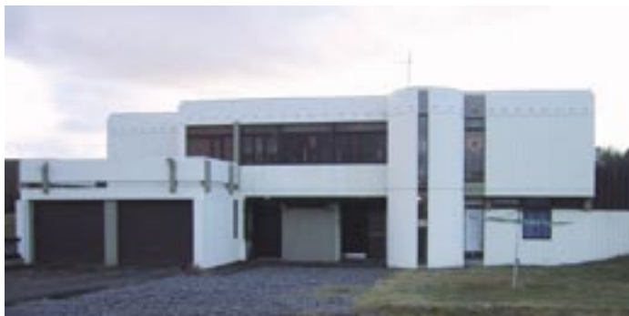
Læknisbústaðurinn á Blönduósi

skipað. Með tilkomu dvalarheimilisins leystust mörg brýn vandamál. Til þessa var enginn ákveðinn staður fyrir gamalt og ellihrumt gamlalmenni. Þau höfðu fengið aðsetur eða húsaskjól hjá ættingjum og vinum eins og í Reykholti á Skagaströnd þar sem fjölskyldan tók að sér að veita slíku fólki húsaskjól og umhirðu. Jafnvel fannst mér eins og til væru einstaklingar, sem virtust eins og tilheyra vissum jörðum. Allt þetta fólk átti nú kost á húsaskjoli og heimili á þessu nýja dvalarheimili í Héraðshælinu, heimili sem hjónin frá Geitaskarði minntust á og gáfu fé til árið 1946. Þetta fólk var þakklátt fyrir húsaskjolið en gerði ekki kröfur eins og nú 50 árum síðar. Þá má að lokum geta þess að hér í Héraðshælinu leit margur Húnavetningurinn sinn fyrsta dag.