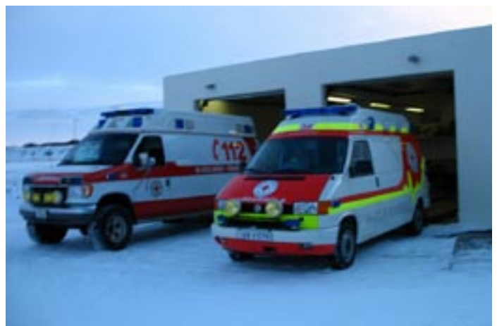
Núverandi sjúkrabílar héraðsins