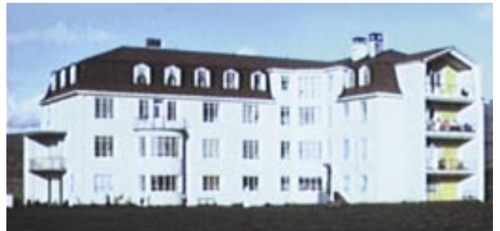
Héraðshælið á Blönduósi