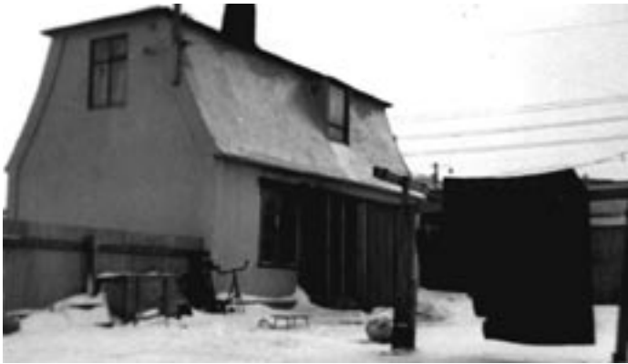
„Líkkistan“ Fyrsta húsið sem notað var undir sjúkrahúshald