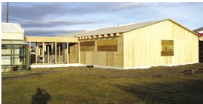
Nýbygging Heilsugæslustöðvar á Skagaströnd sem tekið verður í notkun 1. ágúst nk. Húsið fókheldt 11. febrúar 2006