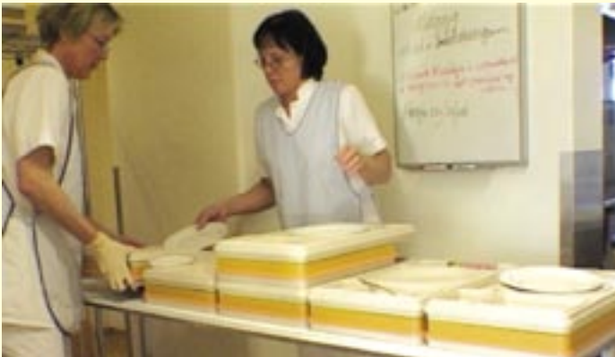
Mikil breyting varð þegar matarbakkarnir voru teknir í notkun